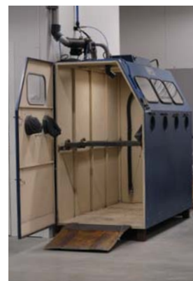
DC Box groß Spezialanpassung nach Kundenwunsch