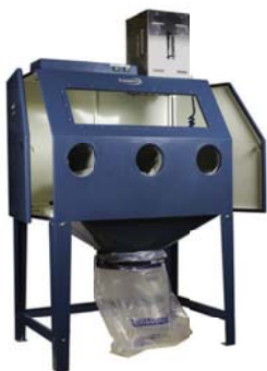
DC Box klein 74701 komplett mit DC AirCube 500