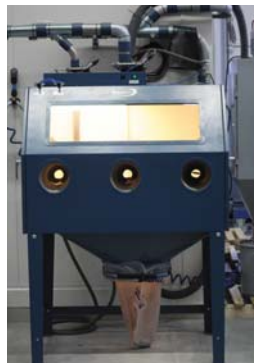
DC Box mittel 7470 DC Box Standard